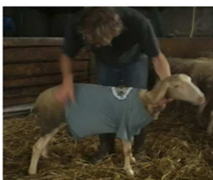
Un essai concluant

Le matin du 12 juillet, entre 10 h et 11 h, les 160 brebis de la Bergerie des Abers vont se déplacer en peloton de Gorrequear vers la chapelle Saint-Jaoua en empruntant les chemins de Kerastreat, Kerriou, Kerjestin et le Prat.